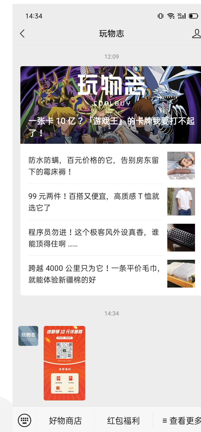
公众号放加群福利