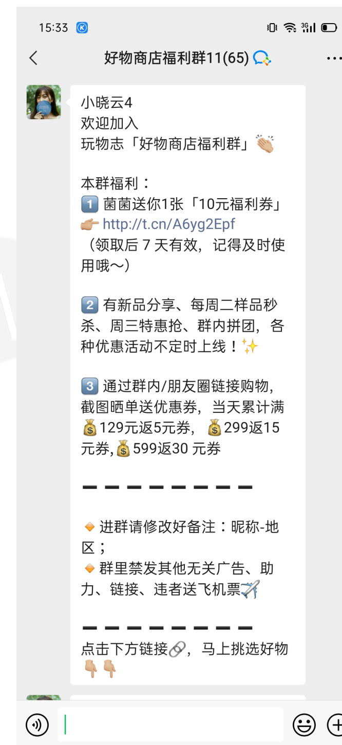
进群自动发送欢迎语

支持企业配置统一的聊天话术，成员也可以自定义个人聊天话术，一键引用，快速回复客户信息，有效提高工作效率。