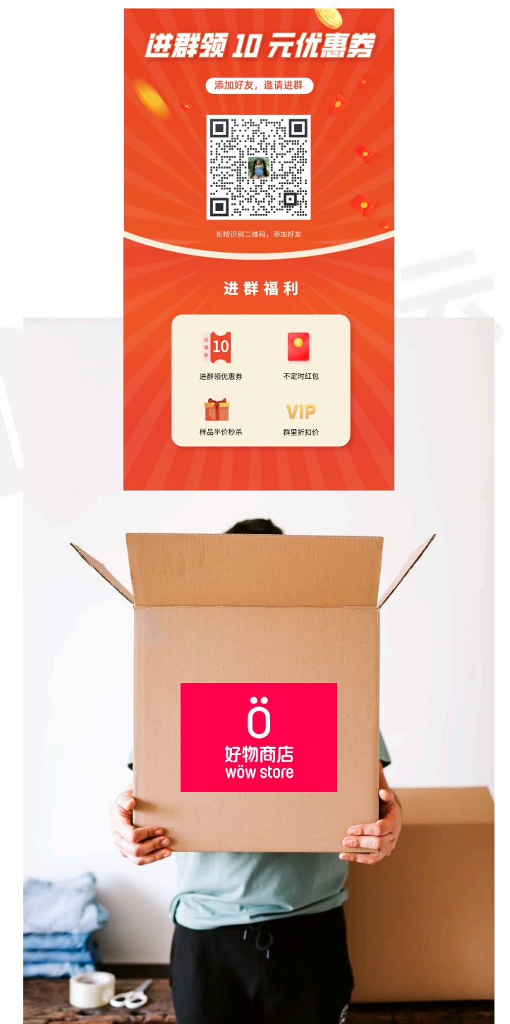
快递包裹放加群卡片